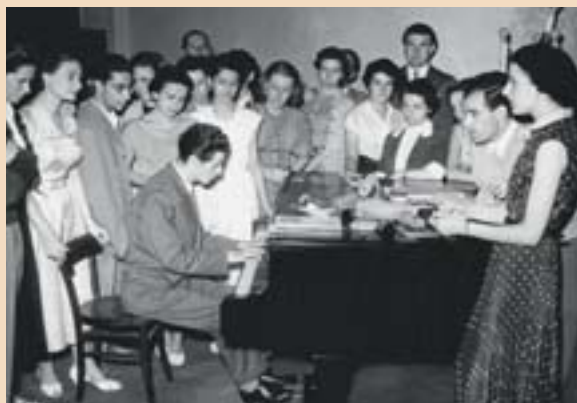
Il maestro Isacco Rinaldi al pianoforte durante una sessione del corso di perfezionamento di Arezzo del 1955.

Io seguii il corso di perfezionamento a Bolzano e poi quello estivo di Arezzo, sospendendo ogni attività concertistica, concentrandomi sullo studio e sull'impegno di assimilare il rapporto speciale con la musica che emanava dal Maestro ("affidarsi alla musica" egli amava ripetere). Poi diventai suo assistente sia di Bolzano che di Arezzo nel 1959 e nel 1960. Mi pagava regolarmente (mi dava cinquantamila lire) e mi stabilii ad Apiano, sede della nuova scuola. Il corso di perfezionamento infatti si trasferì al castello Paschbach ad Apiano presso Bolzano, vicino al lago di Caldaro a 416 metri di altitudine, in mezzo ai vigneti, castello di proprietà della Provincia. L'atmosfera del corso era severa e impegnativa, ma anche molto serena. Gli allievi adoravano il Maestro perché lo sentivano vicino a loro, grazie a quella umiltà e dedizione di cui ho parlato prima. E lui percepiva questo grande, sincero affetto degli allievi e credo che ciò gli facesse bene. Lui amava stare con gli allievi, a mangiare (era un buongustaio e un eccellente cuoco), passeggiare, scherzare, chiacchierare, giocare a ping-pong o stare, tutti insieme, in una bella notte d'estate a contemplare le stelle. Decisamente nessuno che ha frequentato le sue scuole può accettare il cliché di un uomo scontroso, chiuso in se stesso, egoista che gli hanno cucito addosso soprattutto quelli che non l'hanno conosciuto, o l'hanno lasciato solo,