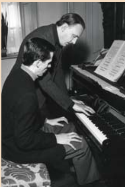
Arturo Benedetti Michelangeli with the pupil Renato Premezzi at the "Accademia Internazionale Pianistica" at the Vigna del Gerbino, Moncalieri on 30 December 1961.

Arturo Benedetti Michelangeli con l'allievo Renato Premezzi all'Accademia Internazionale Pianistica presso la Vigna del Gerbino di Moncalieri il 30 dicembre 1961.