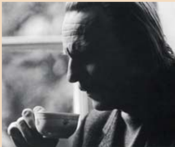
Il Maestro in un'immagine privata della maturità.